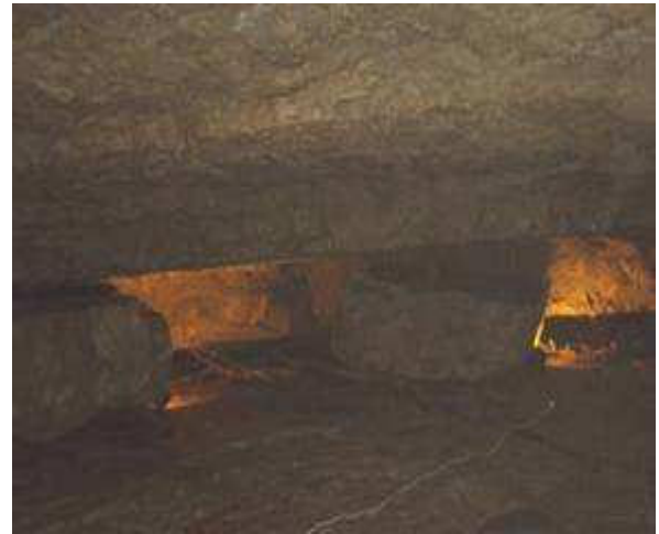
Mise en place des éclairages

L'aménagement et sécurisation a consisté à supprimer de gros blocs, d'agencer des marches, de mettre en place une main courante et de cordes délimitant la zone d'accès. Douze projecteurs économiques ont été mis en place pour mettre en valeur le site.