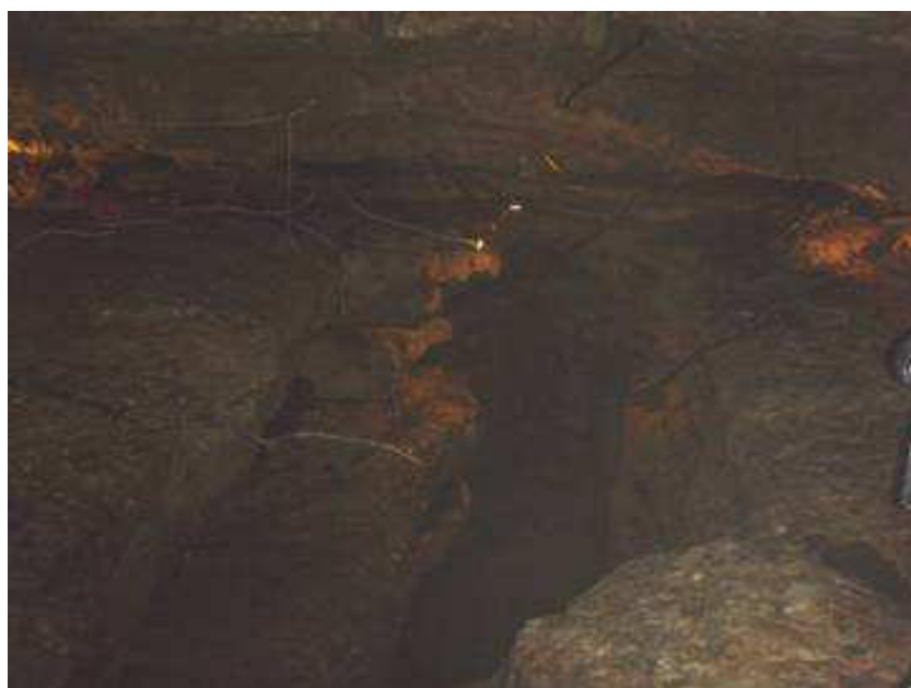
Puits Fenez mis en valeur par les éclairages

Certains, pourtant du village de Voire voisin du puits, ont découvert cette dépression, véritable curiosité naturelle et mythique de la région.