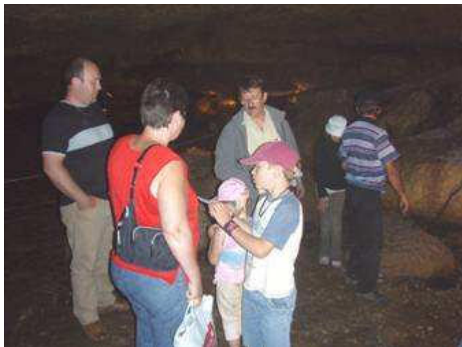
Un public nombreux et familial au puits Fenez

Certains, pourtant du village de Voire voisin du puits, ont découvert cette dépression, véritable curiosité naturelle et mythique de la région.