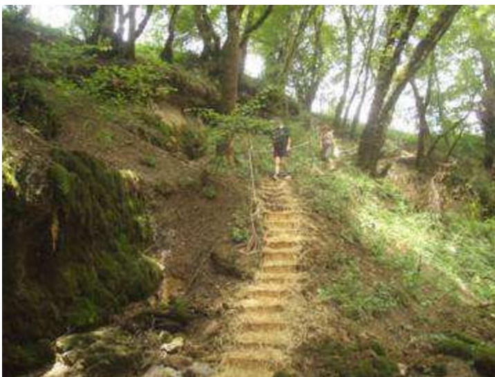
Descente aménagée : marches, main courante et paille comme tapis d'accueil !

L'aménagement et sécurisation a consisté à supprimer de gros blocs, d'agencer des marches, de mettre en place une main courante et de cordes délimitant la zone d'accès. Douze projecteurs économiques ont été mis en place pour mettre en valeur le site.