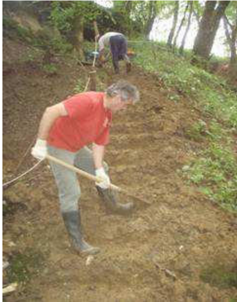
Quelques travaux la veille de la brocante

La mise en place des éclairages s'est déroulée en deux phases : aménagement et sécurisation du site et mise en place des projecteurs.