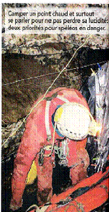
Camper un point chaud et surtout se parler pour ne pas perdre sa lucidité: deux priorités pour spéléos en danger.